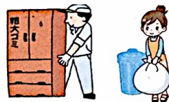
粗大ゴミ・ゴミ出し